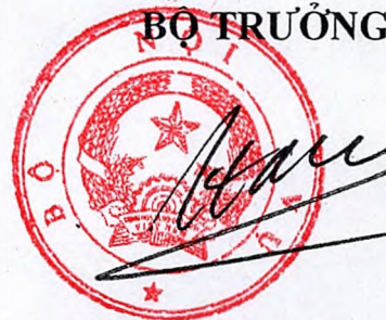
Phạm Thị Thanh Trà